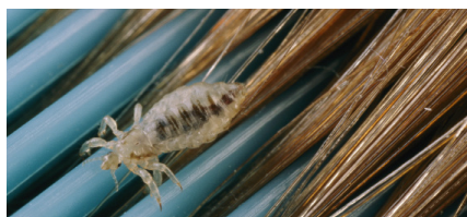
Hoofdluis op een kam.